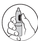
2. Þumalfingurinn á úðahnappinn