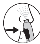
4. Þrýstu á hnappinn