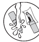
5. Hreinsa og þurrka.